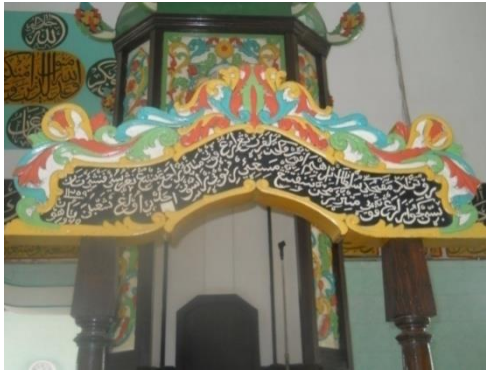
(Dok.; Muslihin Sultan 2012)