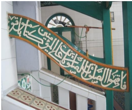
(Dok. Muslihin Sultan, 2010)